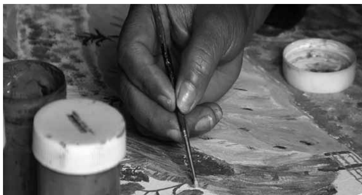
Taller de pintura. 2009